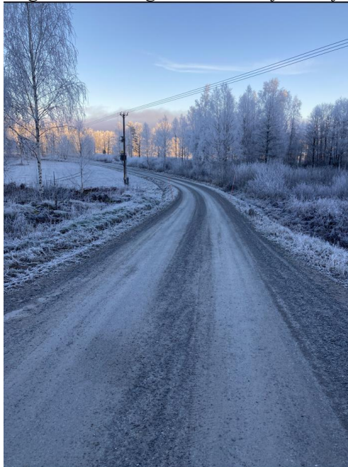
Väg 742 riktning norrut