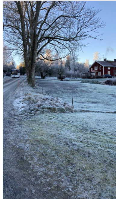
Väg 742 riktning söderut sett från infarten