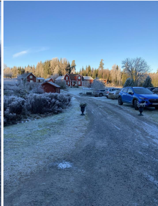
Bostäder mitt emot ut-/infarten till vägen som leder till verksamhetsområdet