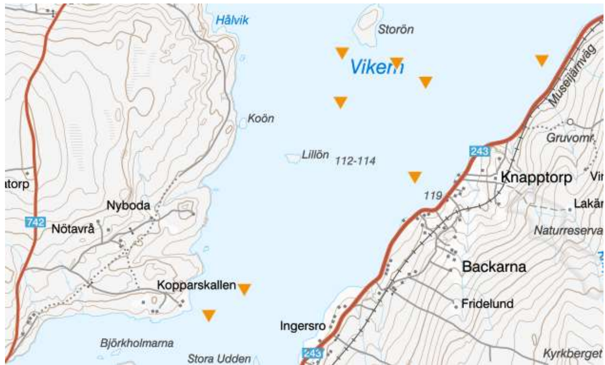
Figuren visar ett antal av de provpunkter för sedimentprovtagning som utfördes av Länsstyrelsen under 2010 och 2022 (SGU, rapportera-data-for-miljogifter/ hämtad 2025-01-25)