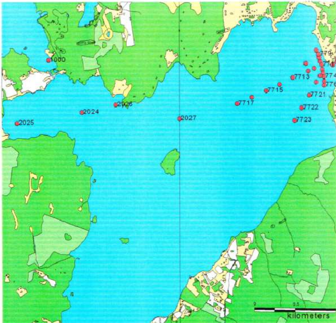
Figuren visar ett antal av de provpunkter för sedimentprovtagning som utförts av flera aktörer under 1900-talet och sammanställts under 2000 av Jan Sävås.