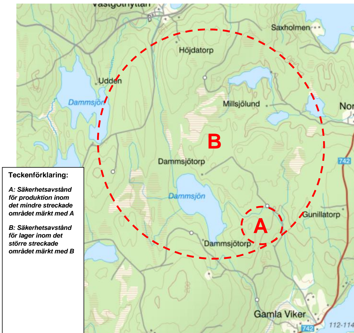
Figur 2 Gamla Viker: Grov kartbild över ungefärligt område. Observera att områdena är grovt uppskattade och har stort utrymme för manövern beroende på hur man väljer att placera anläggningarna. Säkerhetsavstånd A: cirka 430 meter. Säkerhetsavstånd B: cirka 1240 m.