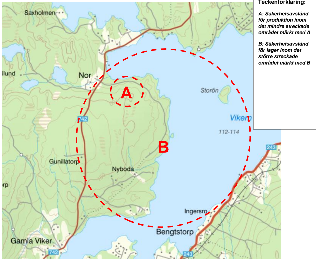
Figur 3 Nor: Grov kartbild över ungefärligt område. Observera att områdena är grovt uppskattade och har stort utrymme för manövern beroende på hur man väljer att placera anläggningarna. Säkerhetsavstånd A: cirka 430 meter. Säkerhetsavstånd B: cirka 1240 m